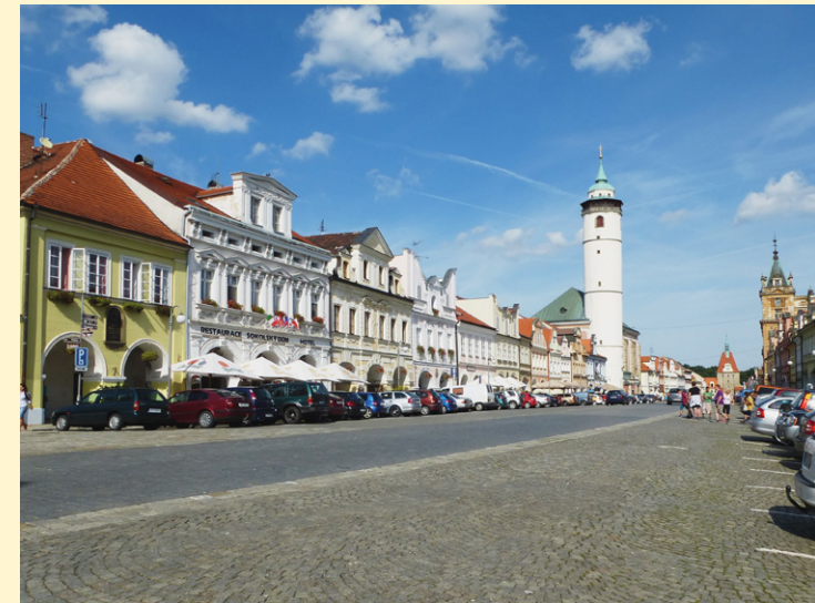
Blick auf Domažlice (Taus)