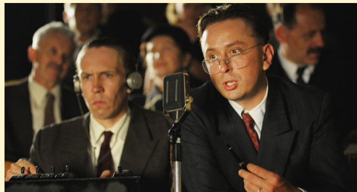
Szene aus dem Film Protektor

20:00 Filmvorführung Protektor (OmeU; CZ 2009).