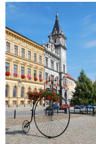
Velké náměstí v Prachaticích

Seminář na Šumavě je přeshraniční akce s tématem dějiny a kultura českých Němců, kterou pořádá kulturní referent pro české země ve spolku Adalberta Stiftera. Původně se tématicky soustředil na historii a kulturu Šumavy, později se proměnil v konferenci se širším tématickým pohledem. Předmětem diskuze jsou hlavně otázky zachování kulturního dědictví Němců z Čech, Moravy a Slezska a vnímání česko-německých dějin na obou stranách hranic.