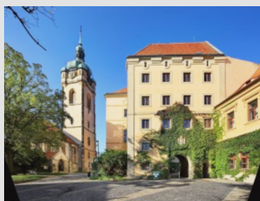
Weinprobe in der Schlosskellerei

vormittags Stadtführung in Leitmeritz/Litoměřice nachmittags Besichtigung von Schloss Mělník: Sitz der Sekundogenitur der Familie Lobkowitz.